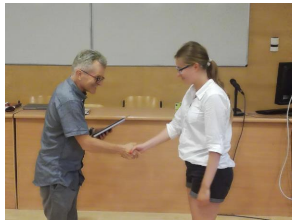
Chwile napięcia i radości