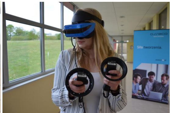
Migawki z konferencji